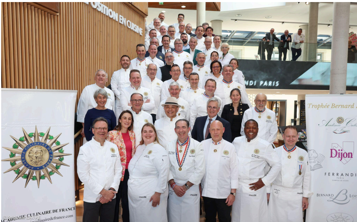
Membres du jury et partenaires du Trophée Bernard Loiseau